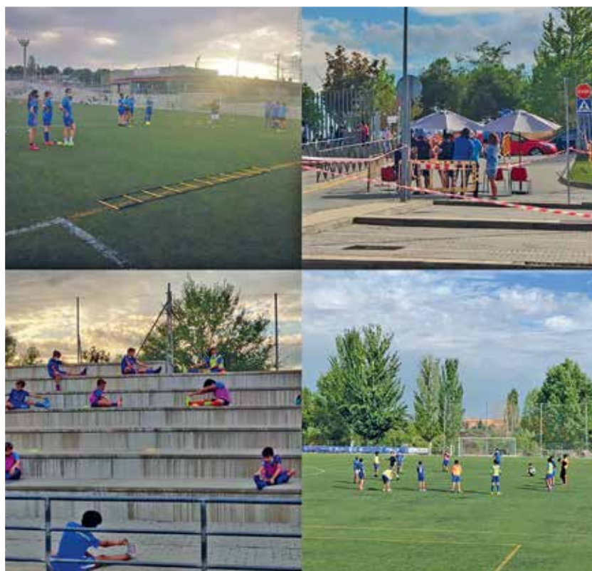
▲ Todos los clubes de Sanse han hecho un esfuerzo para "apostar por el deporte, pero con seguridad".

ya se habían puesto en marcha en los campus de verano. Podemos asegurar que los entrenamientos se podrán realizar sin complicaciones, a la espera de que las distintas Federaciones comuniquen el comienzo de las Ligas. No va a ser una temporada fácil, pero si todos nos comprometemos a cumplir con las normas