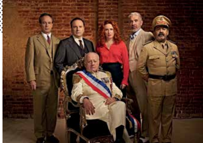
▲ 'La fiesta del chivo', el sábado 3 de octubre, en el TAM.

HUELLAS, de Grupo 10 Hasta el 8 de octubre El GRUPO 10, muestra en esta exposición su obra con distintos matices, soportes y técnicas pero con la misma ilusión que desde 1990, para enseñar su amor por las Artes.