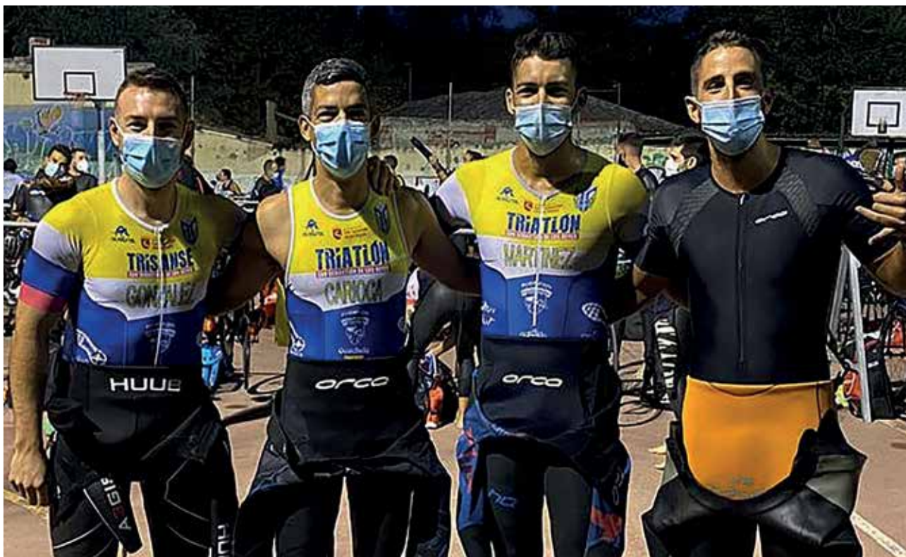
▲ Desde los más pequeños a los mayores, el deporte de Sanse empieza esta temporada a correr con la misma ilusión de siempre.