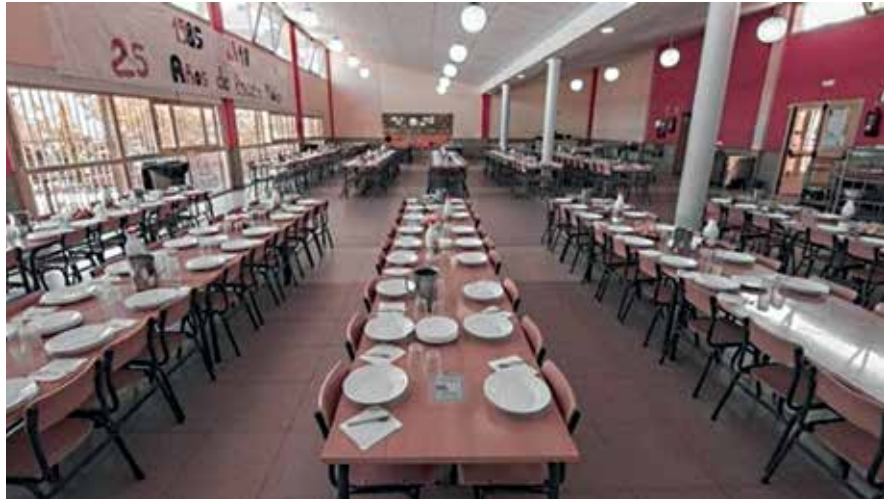
▲ Estas ayudas favorecerán a los ciudadanos con mayor vulnerabilidad económica.

E l Gobierno continúa trabajando para reforzar la protección social de los colectivos más vulnerables y, con ello, mitigar el daño económico y social provocado por la pandemia Covid-19. Por este motivo, y con la firme voluntad de contribuir a la igualdad de oportunidades, el Ayuntamiento, a través de la Concejalía Delegada de Bienestar y Protección Social, pone en marcha un inédito programa de becas de comedor que implica un importe total de 300.000 euros destinado a subvencionar los servicios de comedor para las familias de rentas más bajas. Este programa de becas se integra en 'Sanse te Ayuda', un histórico plan de contingencia dotado con un total de 6,8