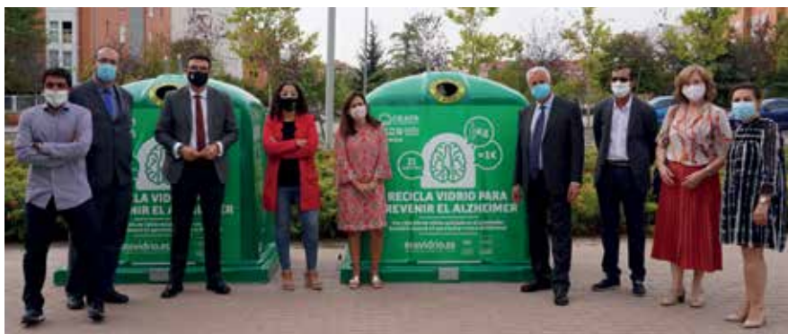
▲ Los responsables municipales con los representantes de esta entidad medioambiental sin ánimo de lucro.

Los ayuntamientos de San Sebastián de los Reyes y Alcobendas se han unido a la campaña solidaria de Ecovidrio para luchar contra el Alzheimer, con la colocación de contenedores personalizados en las calles de sus municipios. Cada kilogramo de envases de vidrio que han depositado los ciudadanos de ambas ciudades en el contenedor verde se han convertido en una donación de un euro para la Confederación Española de Alzheimer (CEAFA).