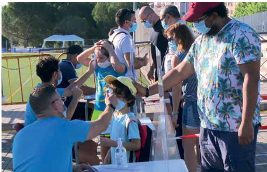
▲ Los campamentos de verano de la Fundación han cumplido con rigor las normas de higiene y seguridad.

La Fundación para el Fomento del Desarrollo y la Integración ha formado parte, por tercer año consecutivo, de los campamentos de verano de nuestra ciudad, aportando monitores para los 18 alumnos con necesida-