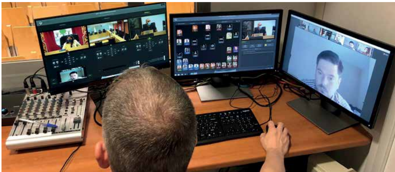
▲ Con los plenos telemáticos se posibilita la participación de una forma absolutamente segura.

El Ayuntamiento moderniza las modalidades de participación en los plenos municipales con la posibilidad de que los concejales de la Corporación puedan participar e intervenir en estos de manera telemática, respondiendo a los retos marcados por la pandemia Covid-19.