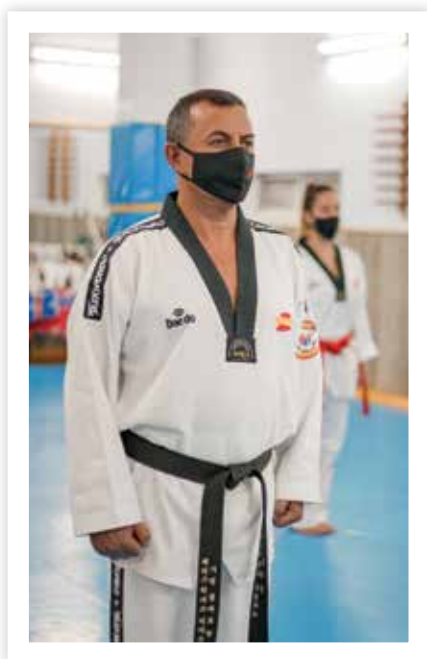
▲ El uso de mascarillas, prioridad máxima.