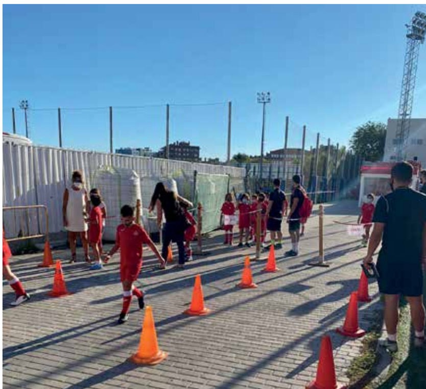
▲ Las normas de higiene se han cumplido a rajatabla en los campus de verano, y no ha habido incidencias.

para que todos los usuarios estén controlados y cumplan con las medidas de seguridad. Desde el Ayuntamiento han controlado dichos protocolos que han tenido que realizar los clubes y todos