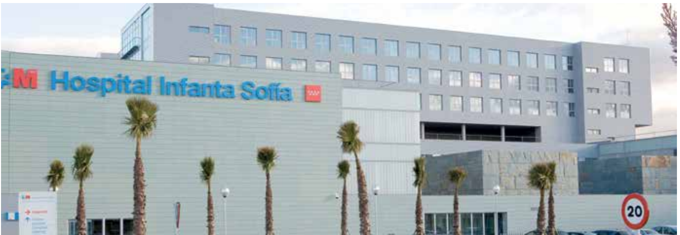
▲ La cuarta torre del Hospital será pronto una realidad, que responde a las nuevas necesidades causadas por la pandemia Covid-19.

El Gobierno municipal ha obtenido una respuesta positiva por parte de la Comunidad de Madrid en relación con la habilitación y puesta en marcha operativa de la Cuarta Torre del Hospital Infanta Sofía. Este avance se produce después de años de reivindicaciones y tras una serie de reuniones mantenidas entre el ejecutivo local con distintas consejerías madrileñas.