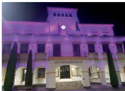
▲ El Ayuntamiento, en la noche del homenaje.