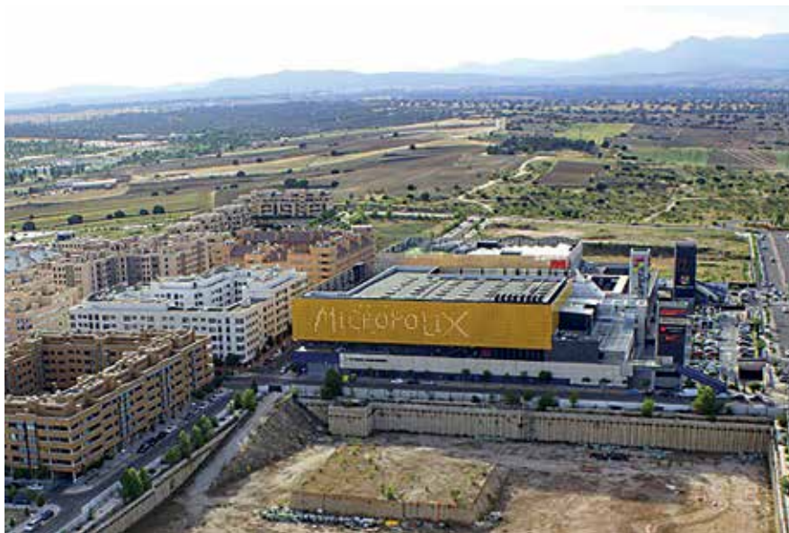
▲ Vista aérea de la zona en las que se impulsará el desarrollo de más de 3.600 viviendas.

El Gobierno Municipal ha logrado desbloquear, después de casi una década, los Planes Parciales para el 'Cerro del Baile' en el Pleno Ordinario del Ayuntamiento celebrado el 17 de septiembre que ha aprobado definitivamente poner en marcha este desarrollo urbanístico que supone una respuesta necesaria a la demanda vecinal para tener más oferta de viviendas en la ciudad.