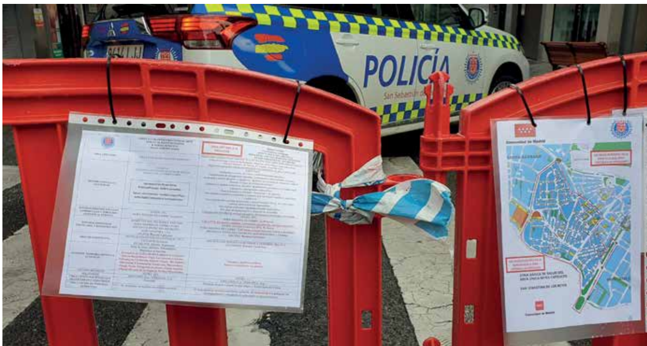
▲ Las acciones se delimitan, en principio, a la zona de Reyes Católicos: Avenida de España, Calle Real, Calle Mayor, Avenida de la Sierra y Avenida de Colmenar Viejo.

Dichas actuaciones se concentrarán determinando una zona que se concentra especialmente en torno al denominado casco antiguo de la ciudad