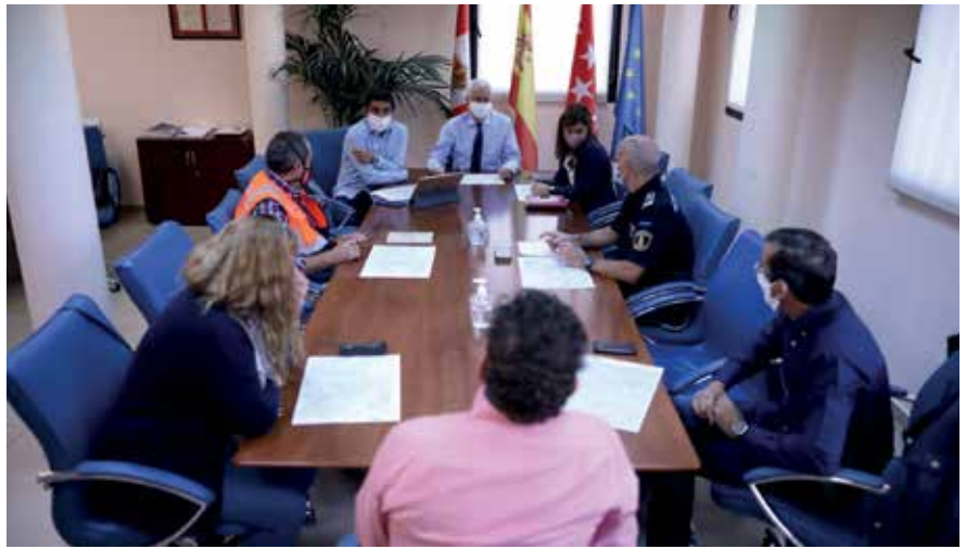
▲ Mesa de Coordinación ante la amenaza del coronavirus.

Este despliegue implica, en primer lugar, un conjunto de acciones coordinadas de limpieza y desinfección que apuntan a las zonas críticas, de mayor tránsito, dentro del área restringida, y que vienen abordadas por la Delegación de Limpieza. En segundo lugar, la Delegación de Parques y Jardines, en coordinación con la Policía Local, realizará distintas acciones de supervisión de las zonas al aire libre y de los parques comprendidos en esta área. En tercer lugar, distintos operativos de Protección Civil intensificarán su actividad con la finalidad de ayudar a todos los vecinos que requieran de algún tipo de asistencia como consecuencia de la situación actual. El objeto principal de estas gestiones es poner los recursos