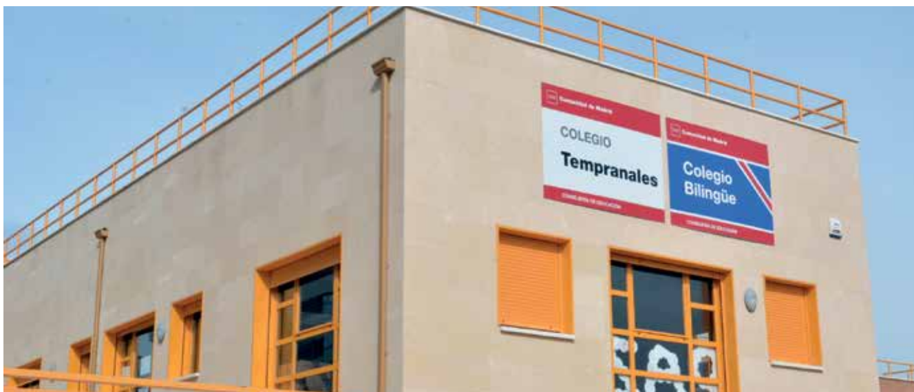
▲ La Declaración Institucional, apoyada por todos los grupos municipales, subraya la necesidad de dotar de infraestructuras de calidad a los centros públicos.

E n el Pleno ordinario celebrado el 17 de septiembre se ha aprobado una declaración institucional que insta a la Consejería de Educación regional a la urgente licitación y ejecución de la última ampliación y fase del Colegio CEIP Los Tempranales.