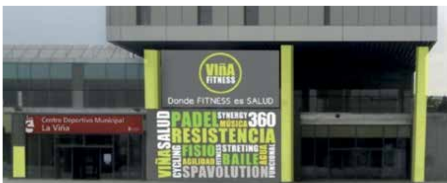
▲ Todos los servicios del centro siguen en funcionamiento, con las medidas de prevención necesarias.

El Centro deportivo municipal Miguel Ángel Martín Perdiguero (Viña Fitness) sigue ofreciendo sus servicios con normalidad. Después de aprobadas las restricciones de movilidad para el área sanitaria de nuestra ciudad, muchos vecinos se