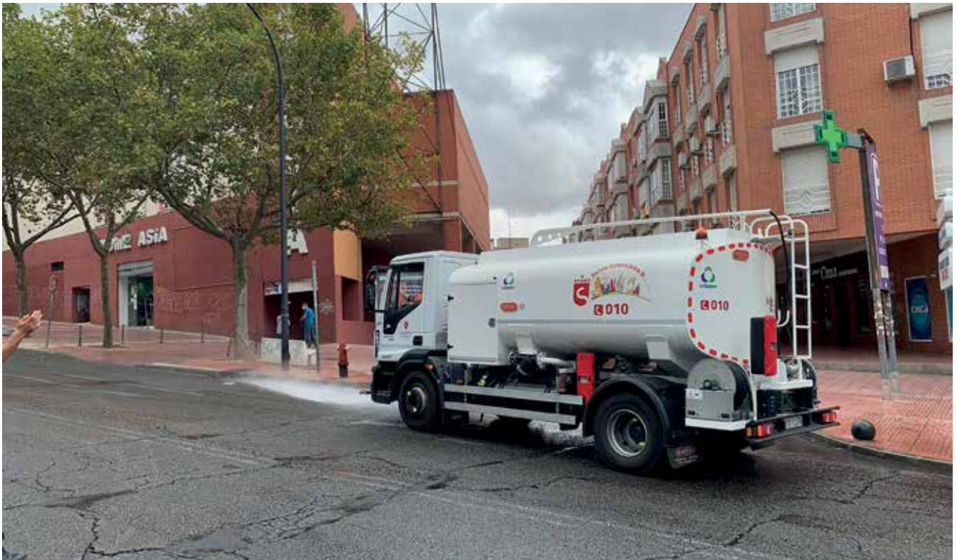
▲ El Gobierno Municipal ha preparado un operativo especial para garantizar la higiene y seguridad en las zonas afectadas por las restricciones.