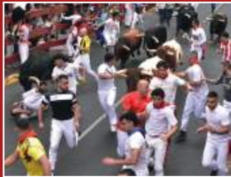
Caída peligrosa en Calle Real Alfonso Moreno (S.S. Reyes)