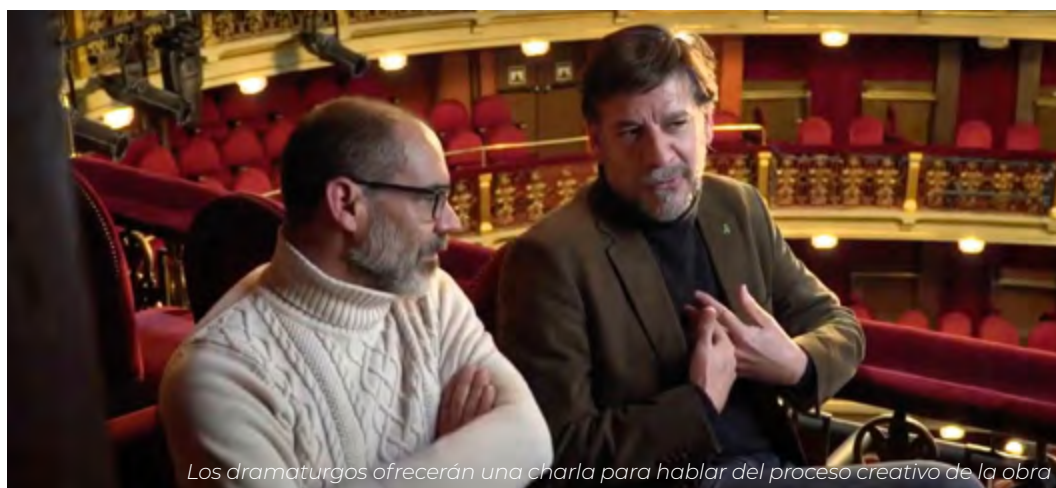
Los dramaturgos ofrecerán una charla para hablar del proceso creativo de la obra

“Hemos escrito una ficción, porque todo lo que ocurre sobre el escenario se desarrolla a partir de conversaciones privadas”