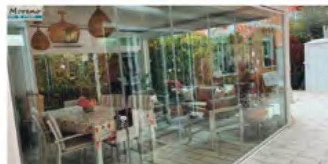
Cortinas de Cristal