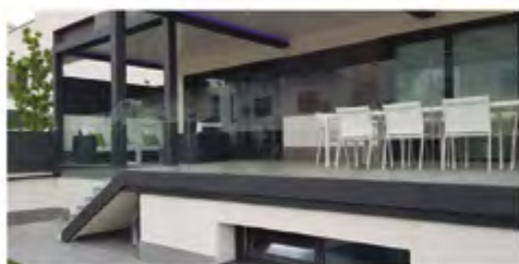
Carpintería de Aluminio y PVC

Cerramientos J. Moreno, empresa destacada en el sector te dará el mejor servicio en los siguientes productos