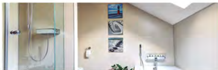
Todo tipo de Mamparas de Baño