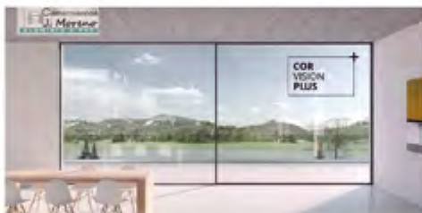
Puertas minimalistas "Corvision"