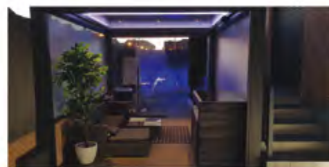
Techos Móviles y Fijos