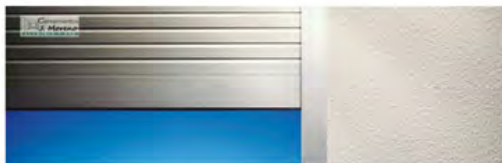
Persianas Electricas y Manuales