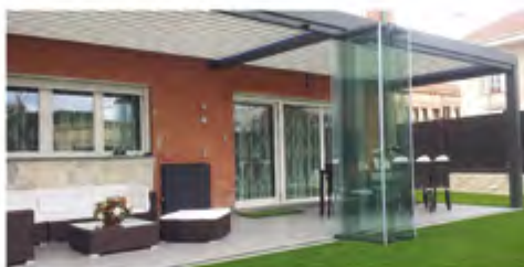
Cerramientos de Terrazas Pacios y Porches