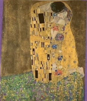
El beso - Klimt, 1909

Representa una pareja que se quiere y está pintado con hoja de oro.