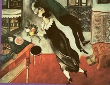
El cumpleaños - Chagall, 1915

Fue pintado para representar la felicidad de casarse con la persona que se ama.